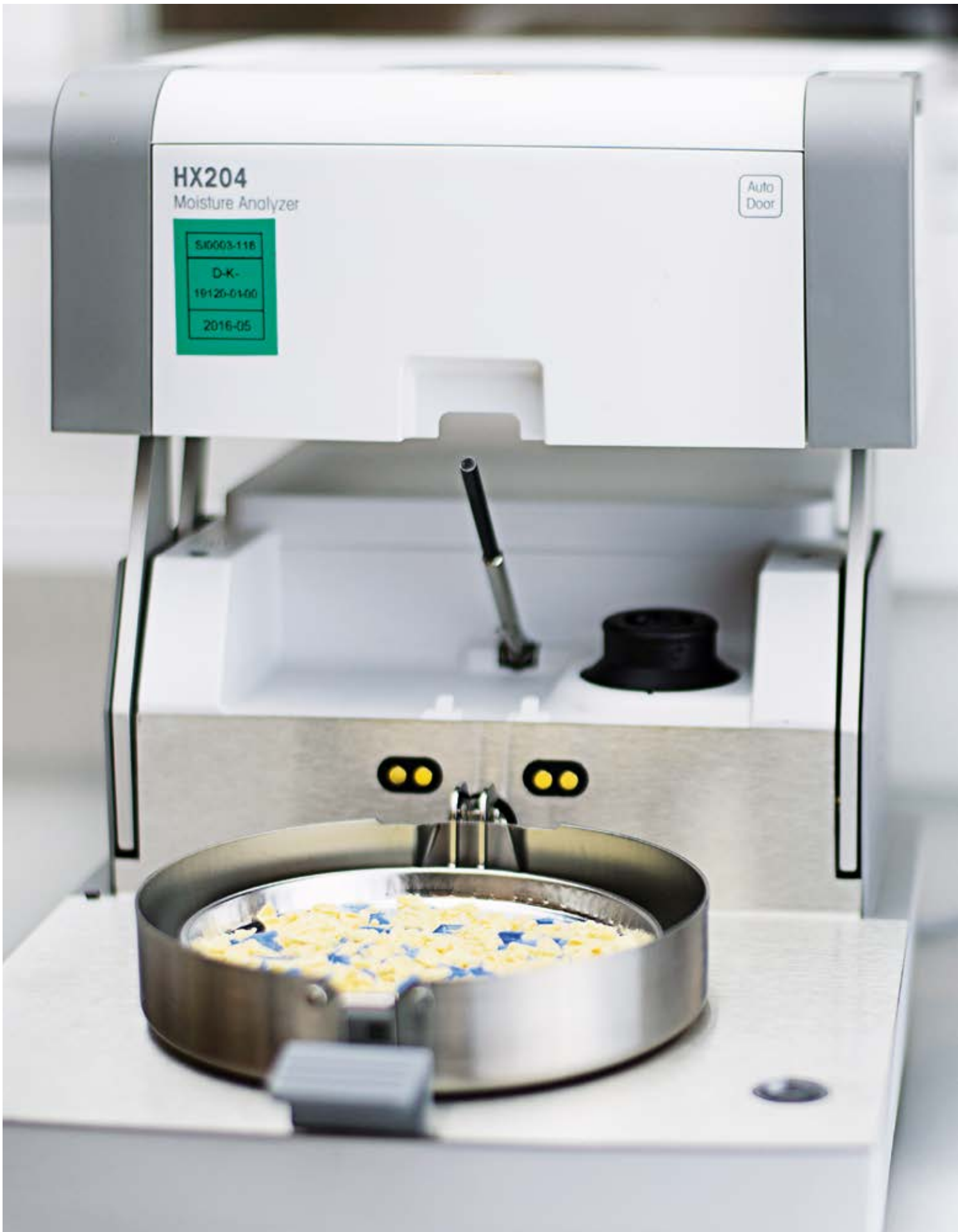
Moisture analyzer Feuchtemessgerät