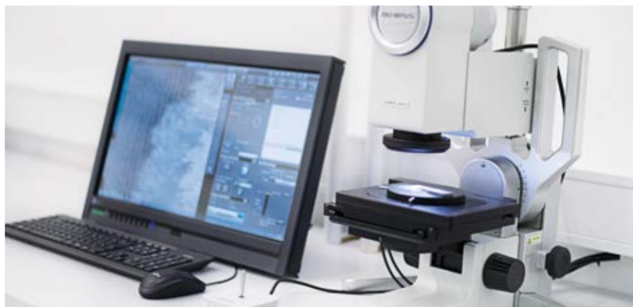
Digital microscope Digitalmikroskop