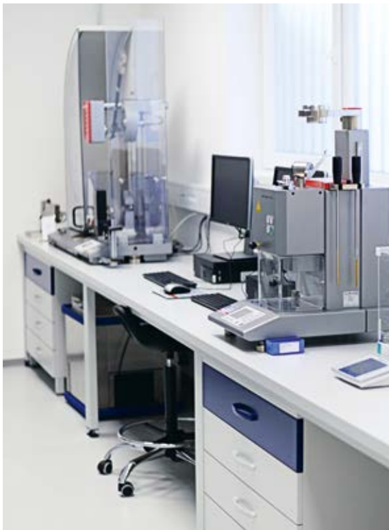
Tensile tester and extrusion plastometer Pendelschlagwerk und Fließprüfgerät

Der Widerstand des Materials gegen Schläge wird in einem Schlagversuch nach Charpy und Izod gemessen, mit oder ohne Kerbe und bei 23 °C und -30 °C. Die Prüfungen werden nach den Normen ISO 179, ISO 180 ausgeführt.