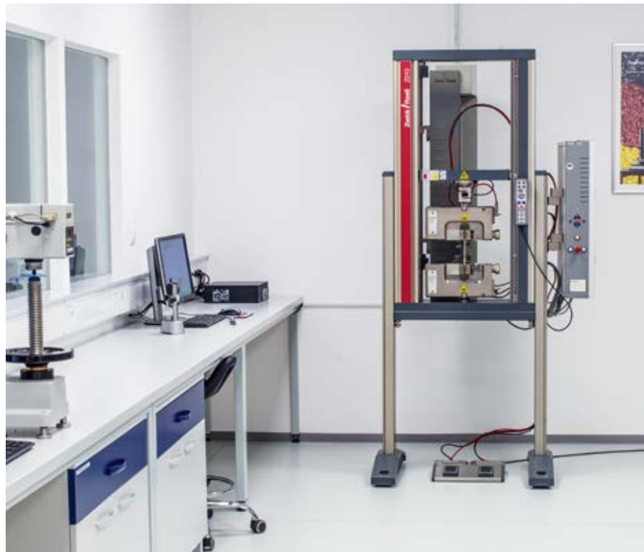
Hardness tester and universal testing machine Härteprüfgerät und Zugprüfmaschine