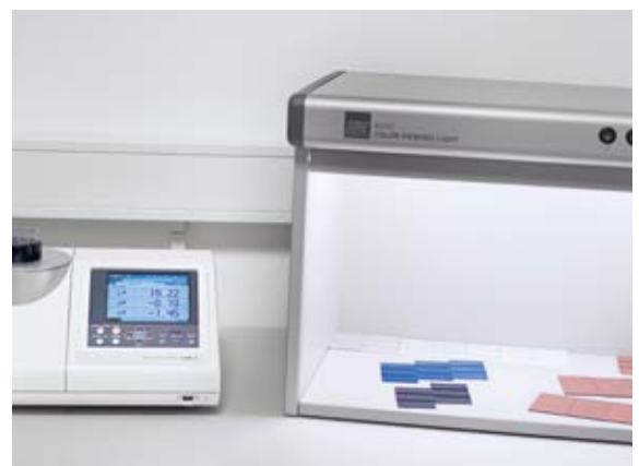
Spectrophotometer with light cabin Spektralphotometer mit Lichtkabine