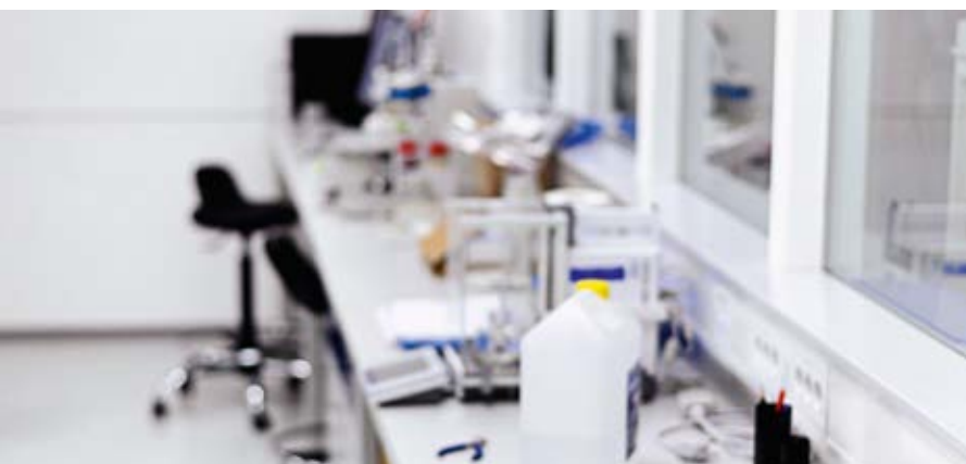
Laboratory for thermal analysis Labor für thermische Analyse