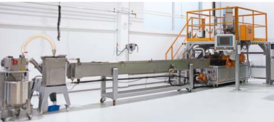
Twin-screw extruder with strand granulator Doppelschneckenextruder mit Stranggranullierung