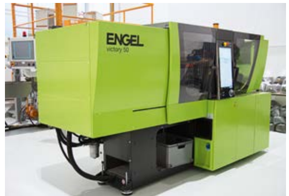
Injection molding machine Spritzgießmaschine