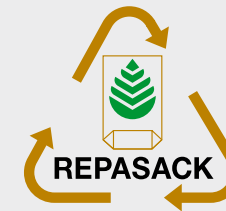
Wortbildzeichen ohne Füllgutbezug Keine eigene Verwertungsfraktion. Diese Säcke sind entsprechend den Inhaltsstoffen einer der links genannten Füllgutgruppen zuzuordnen.

Die oben genannten Füllgutgruppen müssen getrennt voneinander und entsprechend gekennzeichnet an den Annahmestellen abgegeben werden.